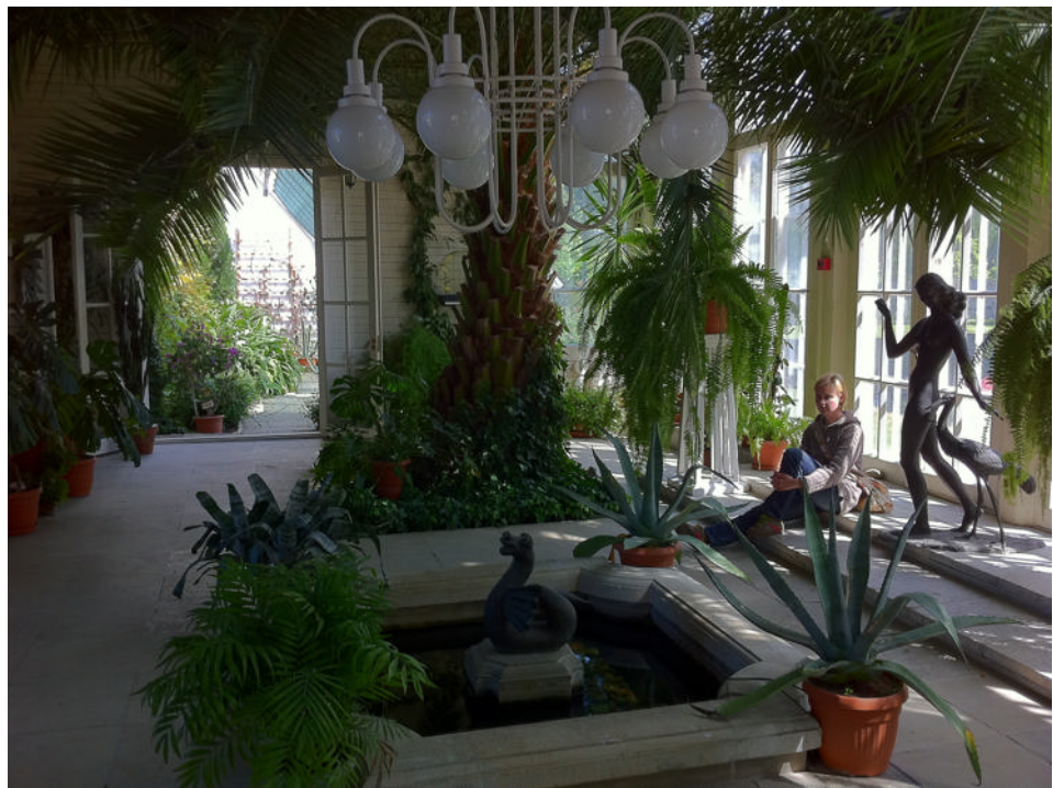
Orangerie, Gutshof-Freilichtmuseum Palmse, Foto: Dirk Heinze

Geschichte, Abenteuer oder Romantik. Vor 2 Jahren entstand in einem weiteren Nebengebäude ein Tagungszentrum. So ist inzwischen das Stiftungsteam auf 20 Festangestellte und weitere 20 Saisonkräfte angestiegen. Bei diesen Zahlen sind die Gärtner schon eingeschlossen, denn auf dem weiten Terrain sind nicht nur Bäume, Wiesen und Blumen zu pflegen, sondern auch ein im 18. Jahrhundert angelegter Obstgarten mit überaus seltenen Sorten.