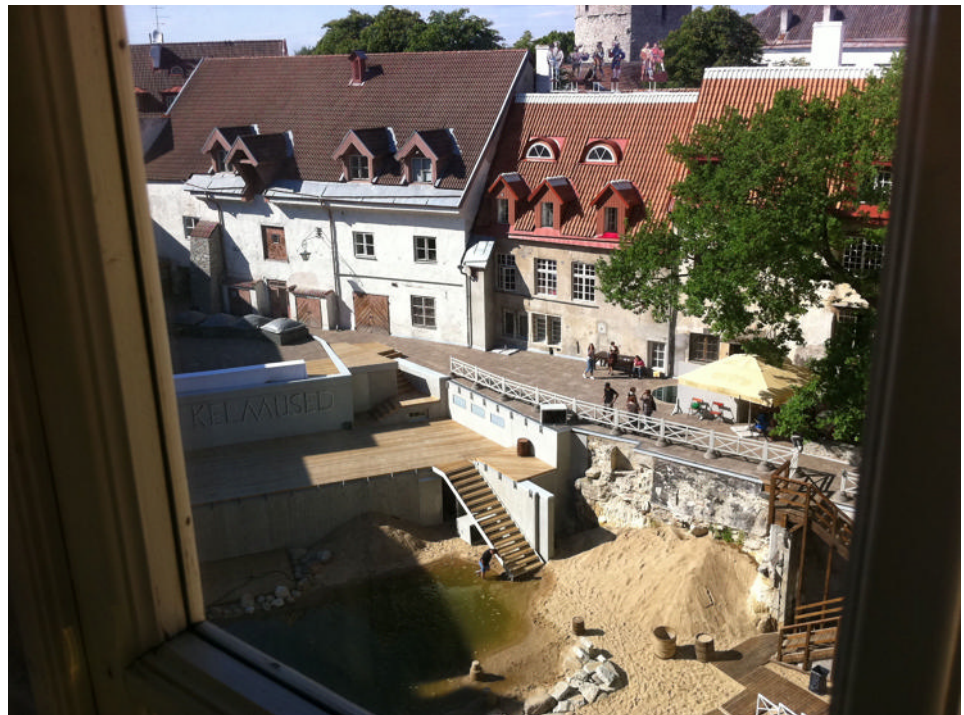
Blick in den Innenhof des Stadttheater mit der Open-Air-Bühne

Beitrag von Gudrun Euler, Korrespondentin, Hamburg/Frankfurt a.M. Email: ge@kulturmanagement.net