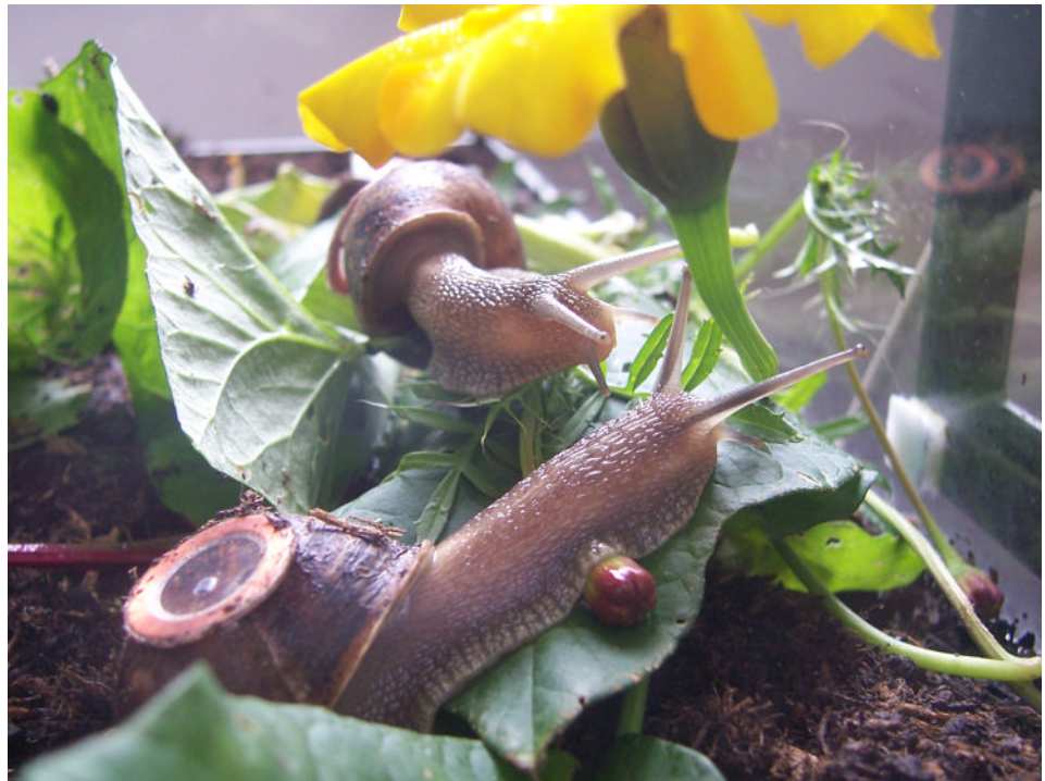
boredomresearch, Real Snail Mail

mat oder den europäischen Führerschein, scannen und erhält anschließend alle Informationen zu seiner Person, die sowohl in den verschiedensten weltweit verstreuten Datenbanken als auch im Internet zur Verfügung stehen. Alle diese Daten werden dem Besucher auf einem großen Display zur Verfügung gestellt, darunter unter anderem auch Informationen zur Gesundheit und der finanziellen Situation der Person oder ob diese polizeilich gesucht wird. Die Daten werden anschließend sogar mit den Durchschnittswerten der Europäischen Staaten verglichen. Für einen selbst ist es schon ein wenig erschreckend, wenn man etwa plötzlich mit seiner durchschnittlich verbleibende Lebenszeit konfrontiert wird. Dem Besucher wird klar vor Augen geführt, wie durchschaubar sein Leben doch eigentlich ist. Vor 20 Jahren waren solche Vorstellungen noch Stoff für futuristische Kriminalfilme - heute ist es schon Teil der (virtuellen) Realität!